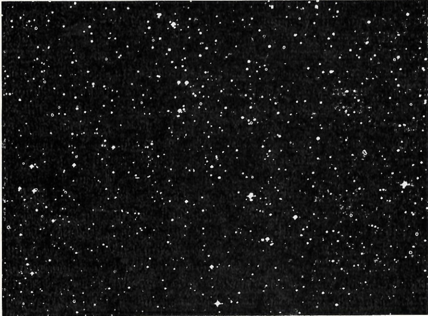
Sólnamor í vetrarbraut okkar.

En þar sem sólin er okkar sól og jörðin er okkar sérstaka heimkynni, þá höfum við lengst af litið á sólhverfi okkar sem talsverðan hluta alheimsins. Eftir því sem könnun geimsins hefur tekið meiri framförum, hafa menn þó komist að þeirri niðurstöðu að svo er ekki. Jörð okkar er einn af ósýnilegum agnarpunktum