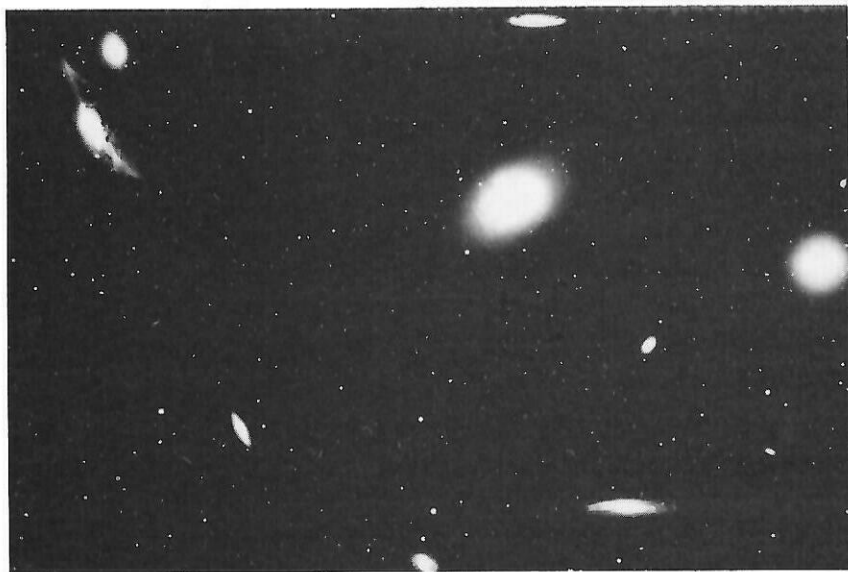
Úr bókinni Galaxies bls. 155.

Um blávegu víðgeimsins blikja sólar og vetrarbrautir í meira mæli en tölum verði á komið og vekja undrun okkar og aðdáun á mikilleika alheimsins og þeirra fjarlæggu veralda sem þar getur að líta. Myndin sýnir vetrarbrautahvirfingu í Meyjarmerki í 70 milljóna ljósára fjarlægð.